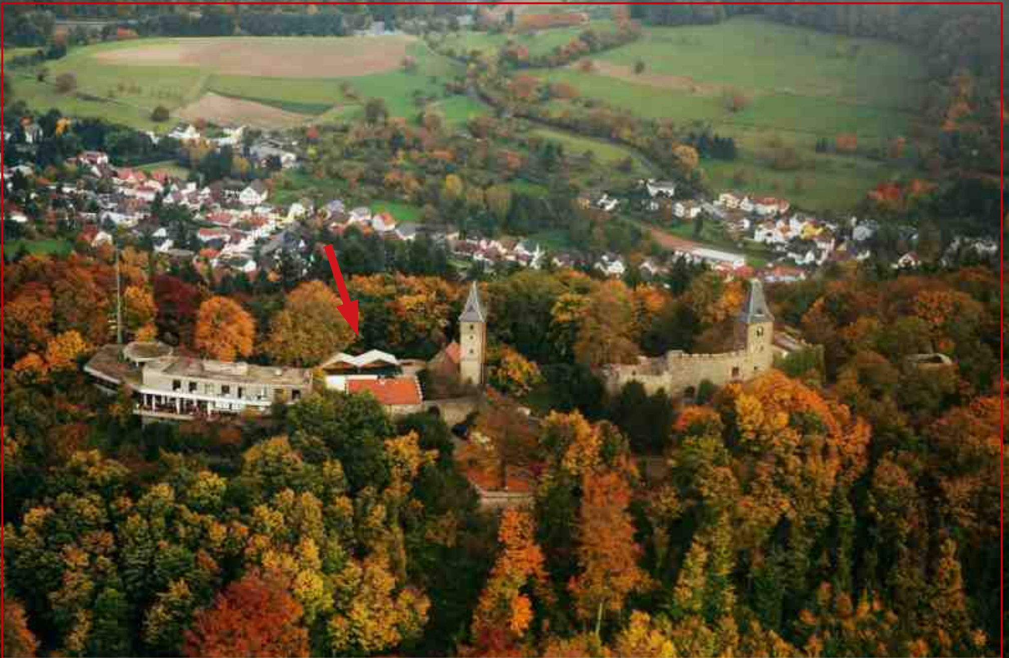
Luftaufnahme Burg Frankenstein: Lage von Philips Gebäude.