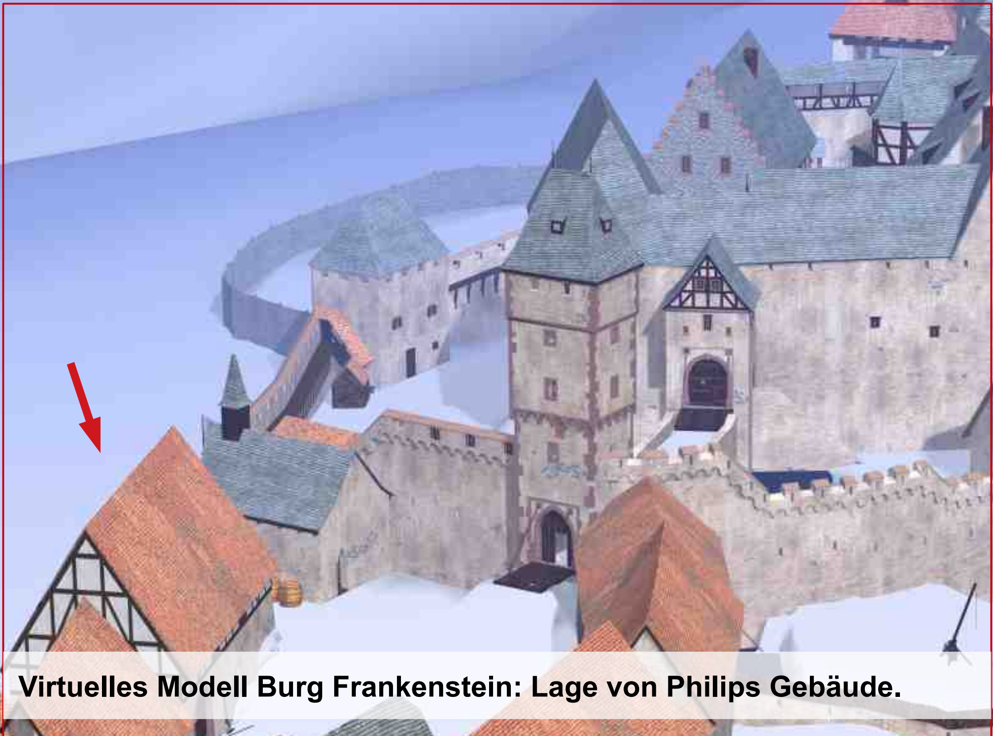
Virtuelles Modell Burg Frankenstein: Lage von Philips Gebäude.