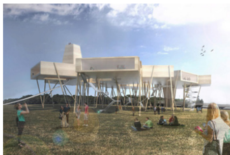
4. Preis: Marte .Marte