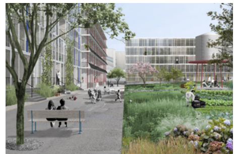
3. Preis: Konfink Schels/Dyvik Kahlen/Treibhaus/Bauart