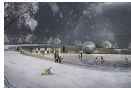
5. Preis: Sinai/ Kolb Ripke