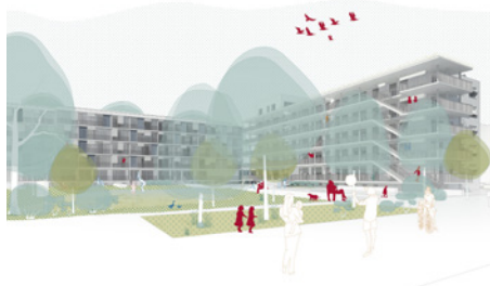
2. Preis: einzueins/YEWO/E7