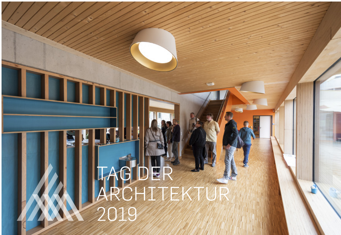
Impression aus dem Jahr 2018: Kindergarten „Holzwürmchen“ Weimar, raum 33 | architekten

Anmeldungen sind ab sofort und bis 11. März möglich