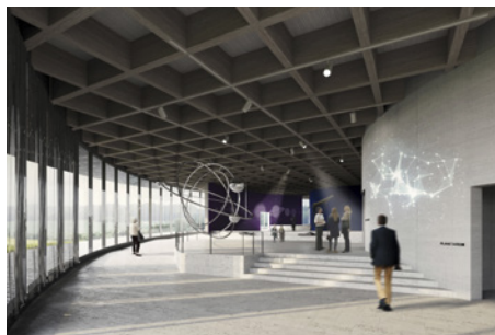
1. Preis: Léonwohlhage/ Atelier Loidl