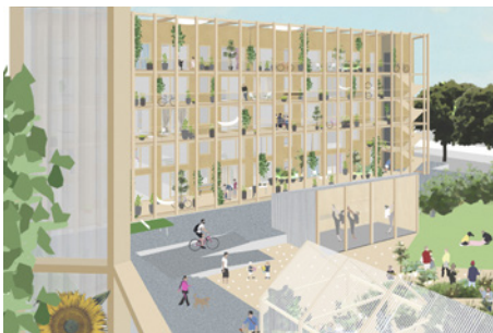
1. Preis: Hütten & Paläste/herrburg/eZeit/ZRS (Ausschnitt der Visualisierung)