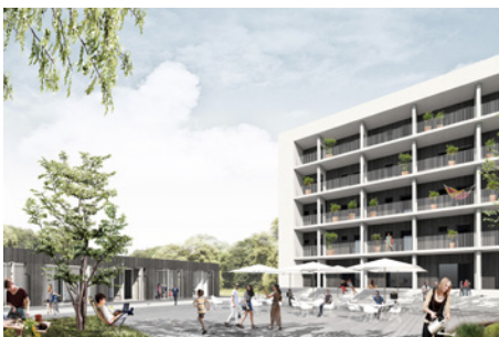
Anerkennung: Schmelzer . Weber / Querfeld Eins / Trag Werk