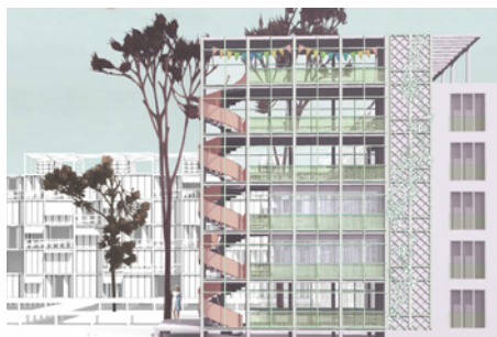
Anerkennung: 03 Architekten / ver.de / TEUBER+VIEL

Weitere Informationen, Pläne und Beurteilung durch das Preisgericht: