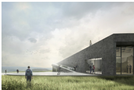
1. Preis: Léonwohlhage/ Atelier Loidl