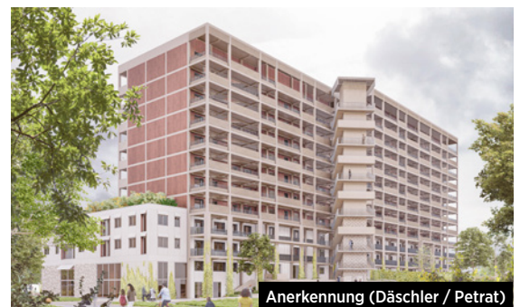
Anerkennung (Däschler / Petrat)

Nach Abschluss des Wettbewerbs wurden die Anmerkungen und Überarbeitungshinweise des Preisgerichts in Gesprächen an die Zweitplatzierten übermittelt und in einem darauffolgenden Workshop mit den KoWo-Fachbereichen und dem Ankermieter AWO ausführlich erörtert. Nach einer sechswöchigen Überarbeitungsphase und einer finalen Präsentation fiel die Entscheidung der KoWo zugunsten des Entwurfs von VITAMINOFFICE ARCHITEKTEN BDA und plandrei Landschaftsarchitektur . Ausschlaggebend waren die über-