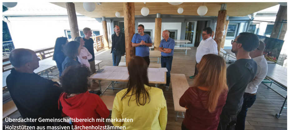
Überdachter Gemeinschaftsbereich mit markanten Holzstützen aus massiven Lärchenholzstämmen