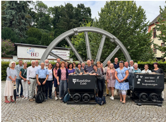
Begrüßung in Eisleben

Exkursion der Kammergruppe Kyffhäuser Südharz