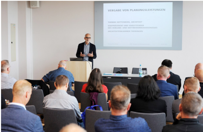
Fachvortrag zur Vergabe von Planungsleistungen

Am 25. September 2024 fand die 34. Mitgliederversammlung des Gemeinde- und Städtebundes Thüringen im Congress-Center der Messe Erfurt statt. Mehrere hundert Bürgermeisterinnen und Bürgermeister, Vorsitzende von Verwaltungsgemeinschaften sowie Mitarbeitende aus Kommunalverwaltungen kamen zusammen, um sich über aktuelle Themen auszutauschen und neue Impulse zu erhalten.