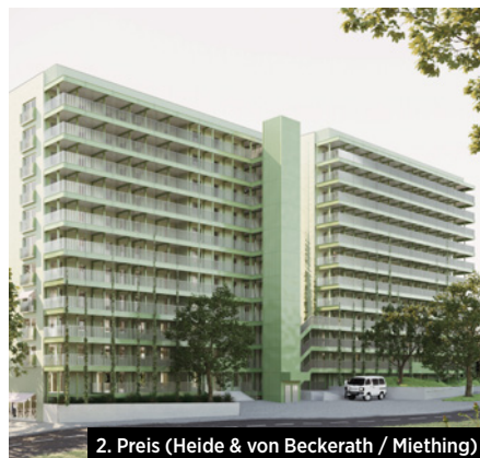
2. Preis (Heide & von Beckerath / Miething)

Heide & von Beckerath Architekten PartG mbB, Berlin; Atelier Miething, Paris