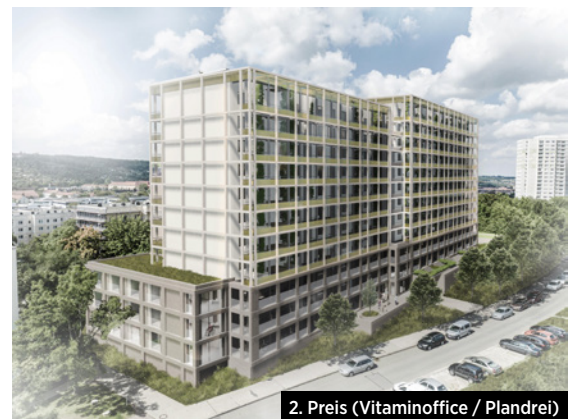
2. Preis (Vitaminoffice / Plandrei)

VITAMINOFFICE ARCHITEKTEN BDA, Erfurt; plandrei Landschaftsarchitektur GmbH, Erfurt