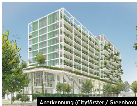
Anerkennung (Cityförster / Greenbox)