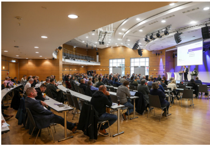
Mehr als 160 Fachleute kamen im Congress-Center der Messe Erfurt zusammen, um zentrale Fragen der Bauwirtschaft zu erörtern.

D er vierte Thüringer Bautag am 7. November 2024 bot eine Bühne für Diskussionen rund um die aktuellen Herausforderungen im Bausektor: Auf Einladung der Architektenkammer Thüringen, der Ingenieurkammer Thüringen, des Bauindustrieverbands Hessen-Thüringen e. V. und des Verbands baugewerblicher Unternehmer Thüringen e. V. kamen mehr als 160 Fachleute in das Congress-Center der Messe Erfurt. Im Mittelpunkt der Veranstaltung standen die kritische Auseinandersetzung mit der anhaltenden Krise im Bauwesen und die Perspektiven für eine wirtschaftlich starke Wertschöpfungskette Bau in Thüringen.