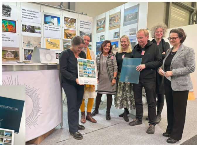
Bilder: Luise Nerlich, bzw. AKT

Neue Bildmappe in der Reihe Bildberührung