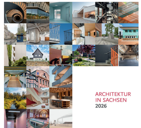
ARCHITEKTUR IN SACHSEN 2026

❑ KALENDERIMPRESSIONEN: www.aksachsen.org/baukultur/kalender